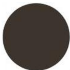
RR32 ТЁМНО- КОРИЧНЕВЫЙ