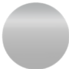
RR40 СЕРЕБРЯНЫЙ МАТОВЫЙ