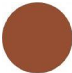
RR750 СВЕТЛО- ТЕРРАКОТОВЫЙ